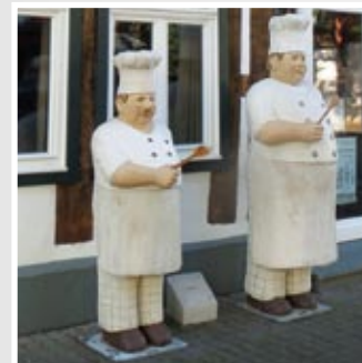
KOCHDUELL, Lange Straße