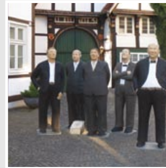
MÄNNER, Lange Straße