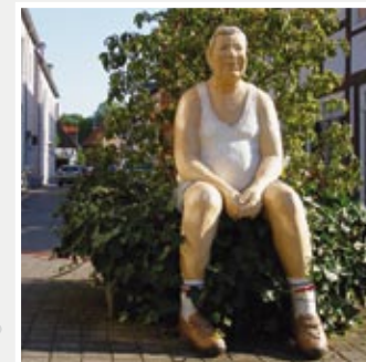
WIEDENBRÜCKER ORIGINAL, Kirchstraße